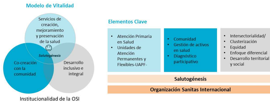
Figura 3: Modelo de salud para zonas rurales, dispersas y comunidades en situación de post conflicto. Propuesta de valor.